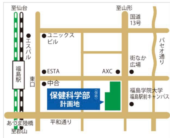
③最寄り駅からの距離、交通機関及び所要時間がわかる図面

※光が丘キャンパスと福島駅前キャンパス間の交通手段と所要時間 移動手段：路線バス 距離：10km 所要時間：30分～40分