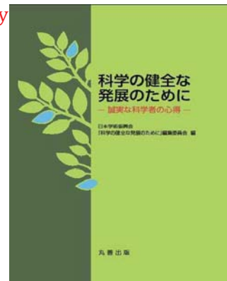
通称 Green Book